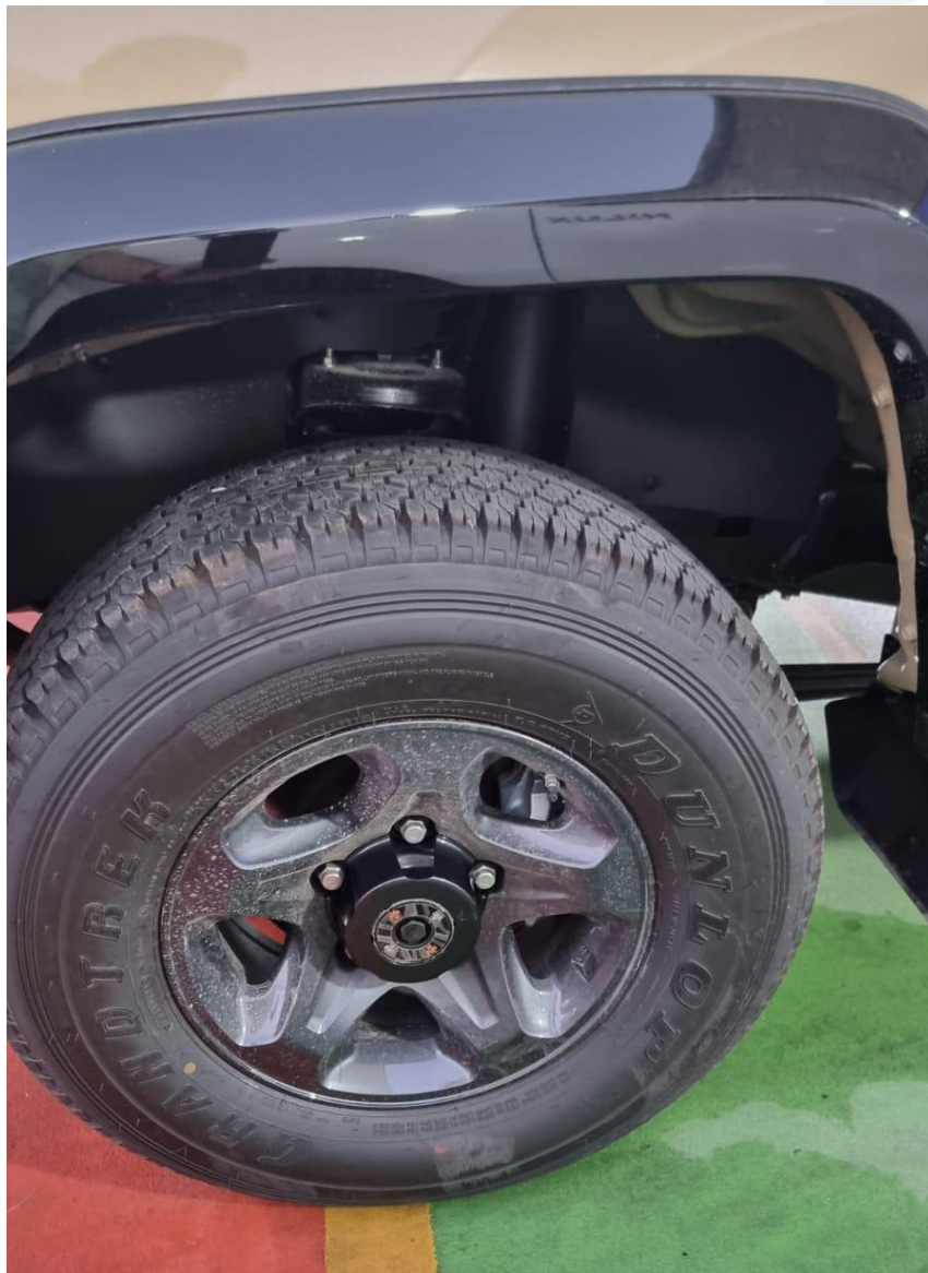
RINES DE 16"